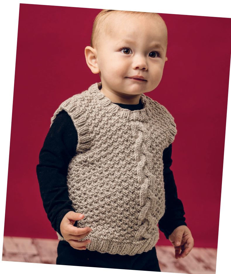
Vest med snoning

X = Vrang på retten og ret på vrangen. □ = Ret på retten og vrang på vrangen.