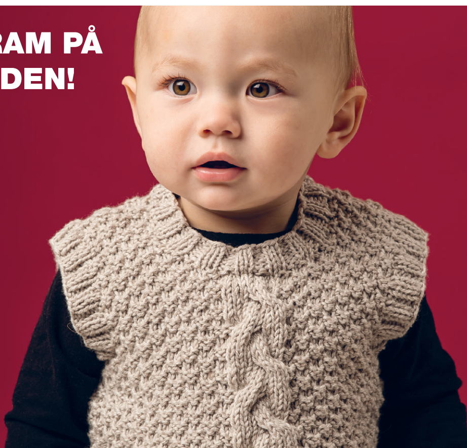
DIAGRAM PÅ BAGSIDEN!

Med rundp 4 (40 cm), strikkes 60(64)64(68) m op langs halsudskæringen, 1 m for hver aflukkede m og 1 m for hver p, men spring hver 4. p over. Strik 5 omg rib 2 r – 2 vr. Luk af i rib.